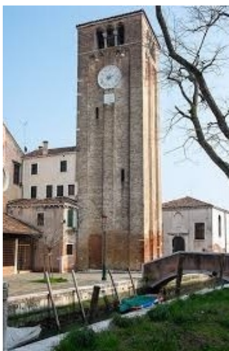
Il campanile di San Nicolò dei Mendicoli visto dal Campo dei Morti.

Si guardò intorno un'altra volta. Anche dalla parte opposta del canale, dove c'è il fianco della chiesa, non passa mai anima viva. Sull'acqua poi il passaggio delle barche è rarissimo e non ce n'era nessuna in vista. C'era invece un grande silenzio e si sentiva solo il ronzio della fabbrica che usciva dai finestroni. Si vedeva qualche colombo che volava attorno al campanile. Appoggiato al muro del cotonificio, senza neppure cercare di