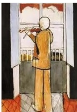
Henry Matisse, "Il violinista alla finestra". Un quadro che per Checco è stato una rivelazione.