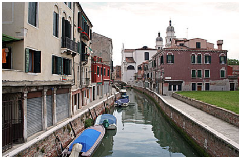
A destra un lato del Campo Rotto oggi, visto dal ponte della Piova. Sullo sfondo il ponte del Cristo.

Stavamo facendo una partita di calcio nel Campo Rotto, quello spiazzo di terra che sta lungo il rio de l'Anzolo, tra il ponte della Piova e il ponte del Cristo. È un campo in terra battuta, con qualche raro ciuffo d'erba e con i resti d'un rifugio antiaereo dei tempi della guerra. Non ci passa quasi mai