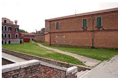
Il Campo Rotto intero, visto dal ponte della Piova. A destra l'alto edificio del Punto Franco. In quest'immagine recente i resti del rifugio sono stati rimossi e si è creata una specie di strada.

ho messo la palla a terra e ho guardato bene verso la porta avversaria, segnata da due pietre bianche che facevano da pali. La traversa nelle nostre porte non c'è, bisogna immaginarsela. Ho cercato di valutare la posizione della barriera e quella del portiere. Lui poteva anche fingere di lasciare un lato scoperto per farmi tirare da quella parte. E sicuramente pensava che